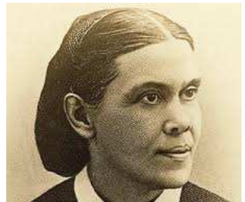
Ellen Whiteová volá po reorganizaci

... Musí dojít k obnově, reorganizaci; moc a síla musí být vneseny do výborů, které jsou nezbytné." [Z úvodní řeči Ellen Whiteové z 2. dubna 1901, na zasedání Generální konference v Battle Creeku.]-- GCB 3. dubna, 1901, pp. 25, 26. LDE 53.3