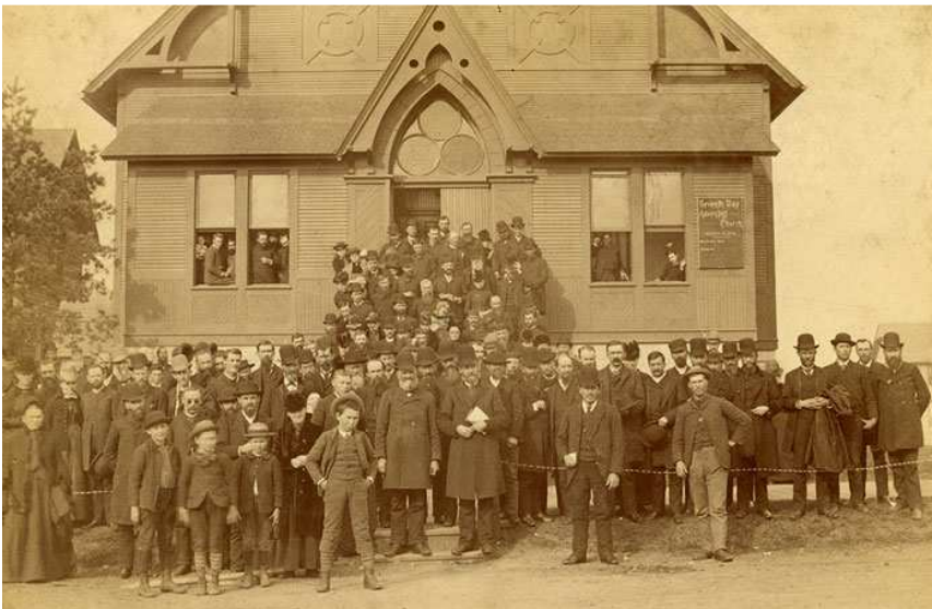
Konference v Minneapolis roku 1888

Lidé, kteří předstírají zbožnost, pohrdají Kristem v osobě Jeho poslů. Podobně jako Židé, oni odmítají Boží poselství. Tito Židé se dotazovali ohledně Krista: "Kdo jest tento? Zda-liž tento není syn Josefův?" On nebyl tím Kristem, kterého Židé očekávali. Tak i dnešní Boží poslové nejsou těmi, které lidé očekávali. FE 472 (ZKV str. 472), 1897.